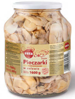
Pieczarki krojone w zalewie