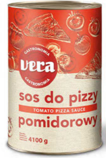
Sos do pizzy pomidorowy