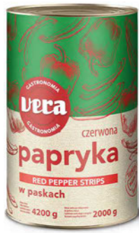
Papryka konserwowa w paskach