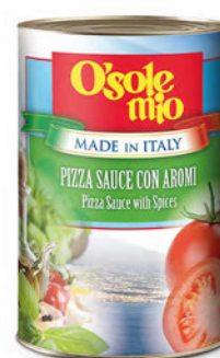
Sos do pizzy pomidorowy z ziołami O'Sole mio