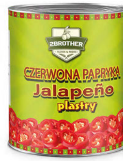
Papryka czerwona konserwowa Jalapeño plastry