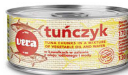
Tuńczyk w kawałkach w zalewie z oleju roślinnego i wody