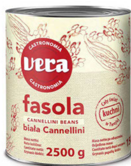
Fasola biała Cannellini