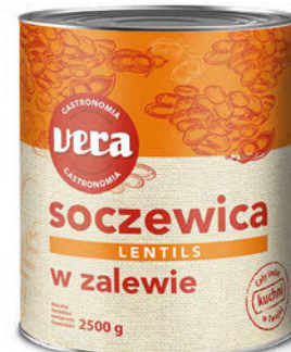
Soczewica w zalewie