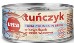
Tuńczyk w kawałkach w sosie własnym