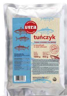
Tuńczyk w kawałkach w sosie własnym