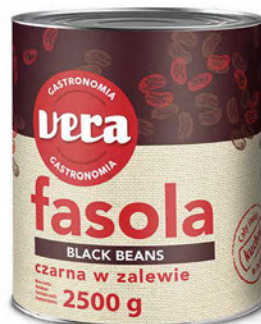
Czarna fasola w zalewie