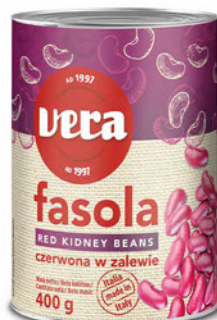
Fasola czerwona w zalewie