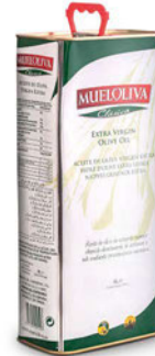
Oliwa z oliwek najwyższej jakości z pierwszego tłoczenia (TIN) Mueloliva