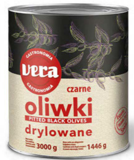
Oliwki czarne drylowane