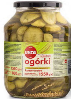
Ogórki konserwowe w plastrach