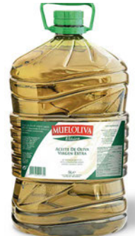
Oliwa z oliwek najwyższej jakości z pierwszego tłoczenia (PET) Mueloliva