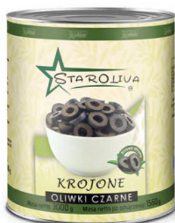
Oliwki czarne krojone