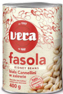
Fasola biała Cannellini