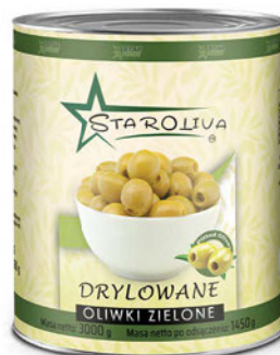
Oliwki zielone drylowane