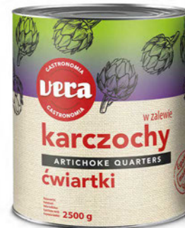
Karczochy ćwiartki w zalewie