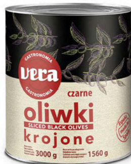
Oliwki czarne krojone