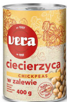
Ciecierzycyca w zalewie