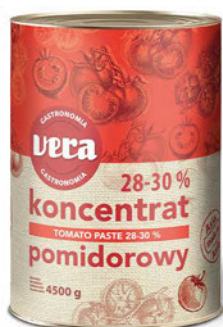
Koncentrat pomidorowy 28-30%