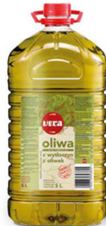
Oliwa z wyłoczyn z oliwek