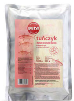
Tuńczyk w kawałkach w oleju roślinnym