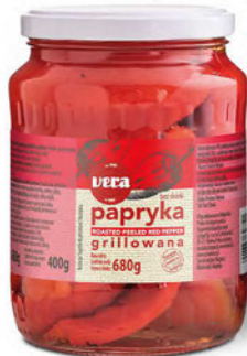
Papryka grillowana bez skórki