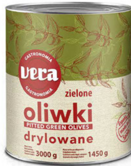
Oliwki zielone drylowane