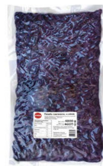
Fasola czerwona w zalewie w puchu