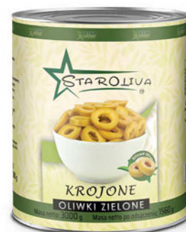
Oliwki zielone krojone