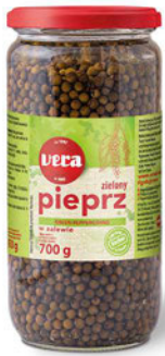
Pieprz zielony w zalewie