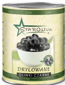
Oliwki czarne drylowane