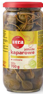
Jabluszka kaparowe w zalewie