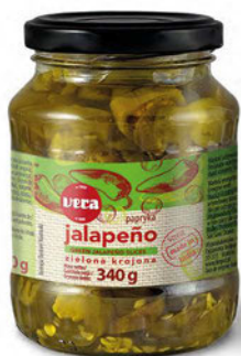
Papryka Jalapeño zielona krojona w zalewie