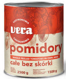
Pomidory bez skórki całe w sosie własnym