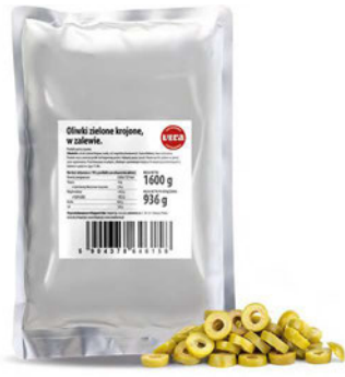
Oliwki zielone krojone w zalewie