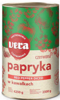
Papryka konserwowa w kawałkach