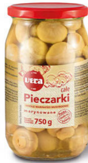
Pieczarki całe konserwowe marynowane w zalewie octowej