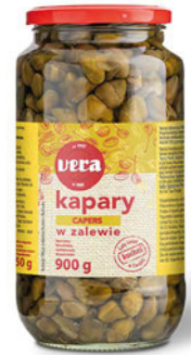
Kapary w zalewie