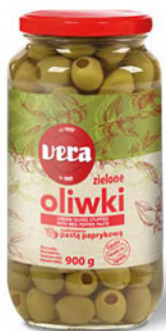
Oliwki zielone nadziewane pastą paprykową