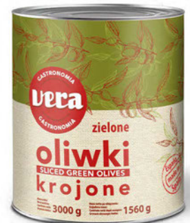
Oliwki zielone krojone