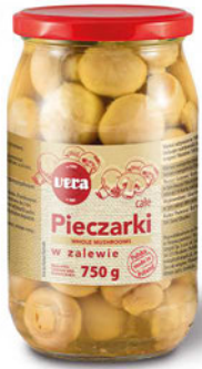
Pieczarki całe w zalewie