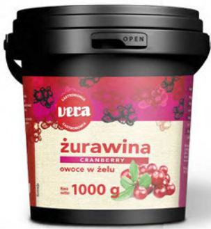
Owoce żurawiny w żelu