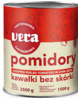
Pomidory bez skórki w kawałkach w sosie własnym