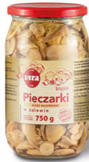
Pieczarki krojone w zalewie