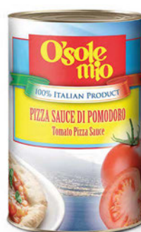
Sos do pizzy pomidorowy O'Sole mio