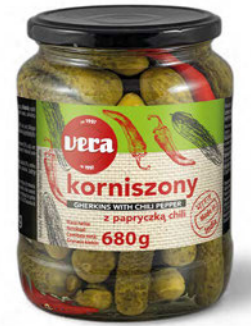
Korniszony delikatesowe z chili