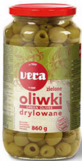
Oliwki zielone drylowane