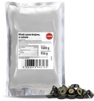
Oliwki czarne krojone w zalewie