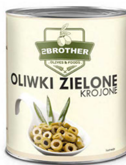
Oliwki zielone krojone