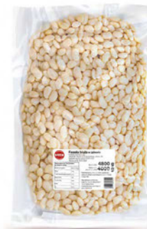
Fasola biała w zalewie w puchu