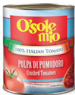
Pulpa pomidorowa O'Sole mio