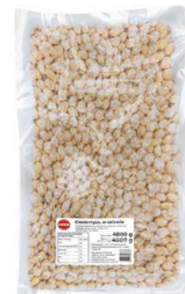
Ciecierzycyca w zalewie w pouchu