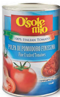
Pulpa pomidorowa O'Sole mio