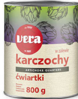
Karczochy ćwiartki w zalewie