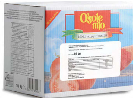
Pulpa pomidorowa O'Sole mio bag in box 2x5kg