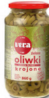
Oliwki zielone krojone