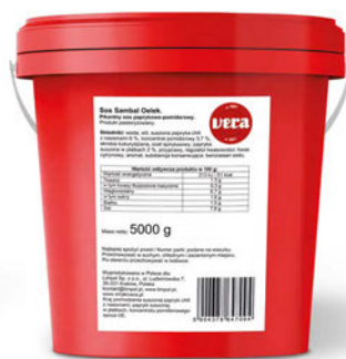
Sambal olek, pikantny sos paprykowo-pomidorowy