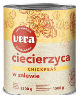
Ciecierzycyca w zalewie