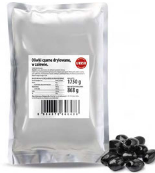
Oliwki czarne drylowane w zalewie