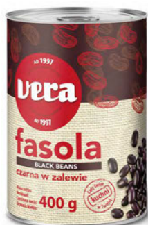
Czarna fasola w zalewie