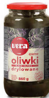
Oliwki czarne drylowane