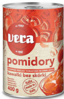
Pomidory bez skórki w kawałkach w sosie własnym