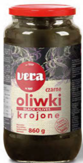
Oliwki czarne krojone