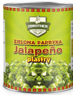
Papryka zielona konserwowa Jalapeño plastry