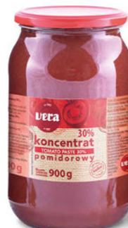
Koncentrat pomidorowy 30%