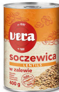
Soczewica w zalewie