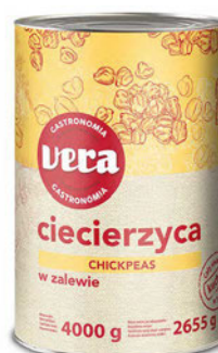
Ciecierzycyca w zalewie