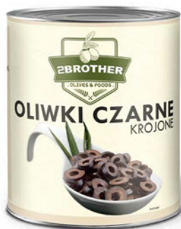
Oliwki czarne krojone