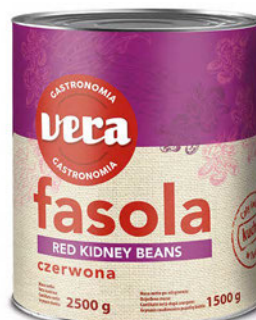
Fasola czerwona w zalewie