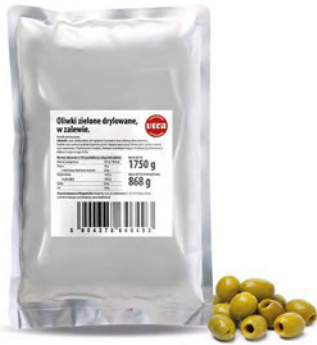
Oliwki zielone drylowane w zalewie