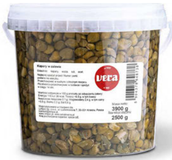
Kapary w zalewie