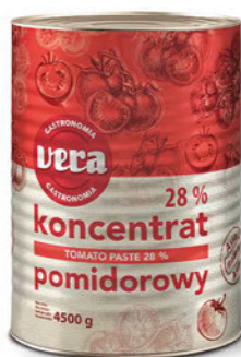
Koncentrat pomidorowy 28%