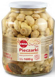
Pieczarki marynowane całe