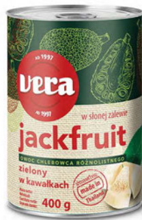
Jackfruit zielony w kawałkach