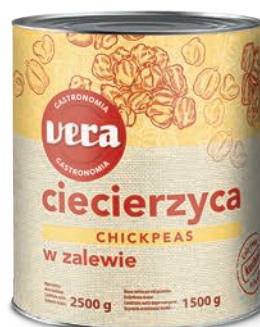
Ciecierzycza w zalewie