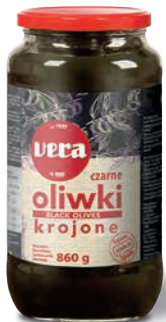
Oliwki czarne krojone