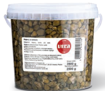
Jabluszka kaparowe w zalewie