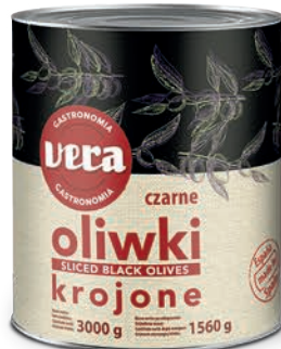
Oliwki czarne krojone