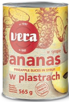
Ananas w plastrach w syropie