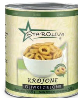
Oliwki zielone krojone