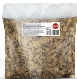
Pieczarki krojone w zalewie