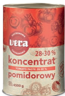
Koncentrat pomidorowy 28-30%