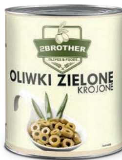
Oliwki zielone krojone