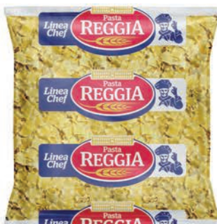
Makaron Maltagliata Riccia łazanki