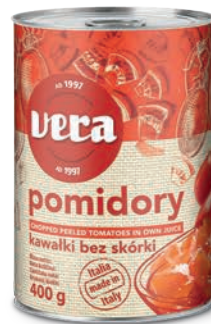
Pomidory bez skórki w kawałkach w sosie własnym