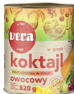
Koktajl owocowy w syropie