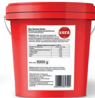
Sambal olejek, pikantny sos paprykowo-pomidorowy