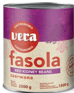
Fasola czerwona w zalewie