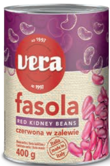
Fasola czerwona w zalewie