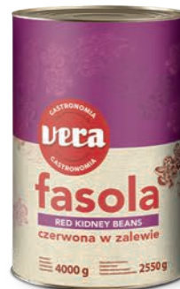
Fasola czerwona w zalewie