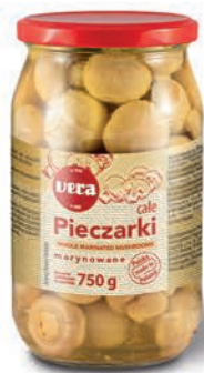
Pieczarki całe konserwowe marynowane w zalewie octowej