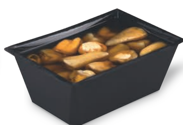
Pikantne zielone papryczki z nadzieniem serowym w oleju