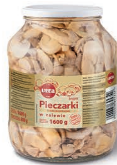
Pieczarki krojone w zalewie