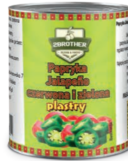
Papryka czerwona i zielona konserwowa Jalapeño plastry