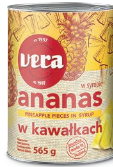
Ananas w kawałkach w syropie