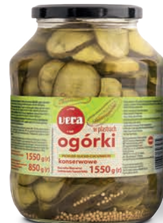
Ogórki konserwowe w plastrach