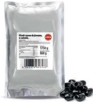
Oliwki czarne krojone w zalewie