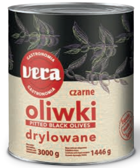
Oliwki czarne drylowane