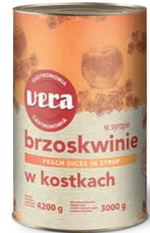
Brzoskwinie w kostkach w syropie