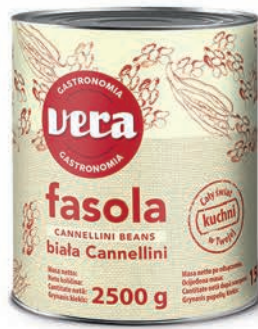
Fasola biała Cannellini