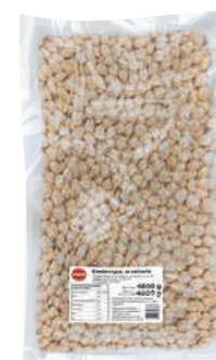
Ciecierzycza w zalewie w pouchu