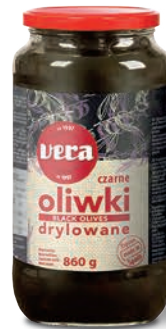
Oliwki czarne drylowane