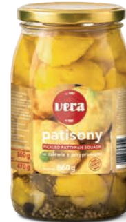
Patisony w zalewie