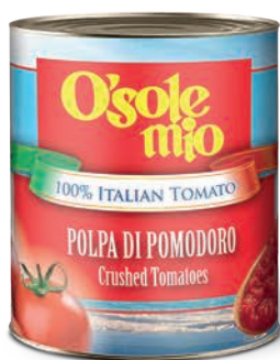
Pulpa pomidorowa O'Sole mio