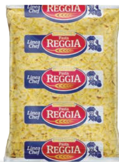
Makaron Farfalle kokardki