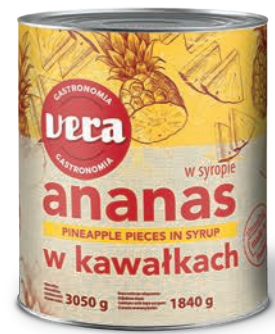
Ananas w kawałkach w syropie