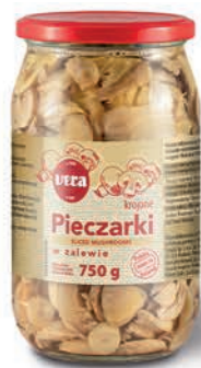
Pieczarki krojone w zalewie