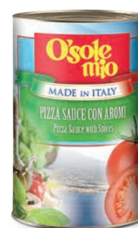
Sos do pizzy pomidorowy z ziołami O'Sole mio