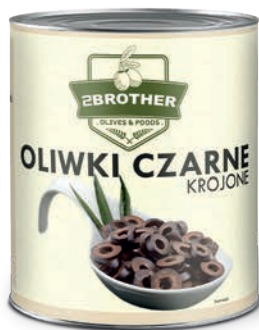
Oliwki czarne krojone