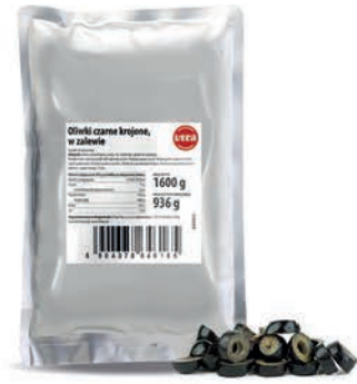
Oliwki zielone krojone w zalewie