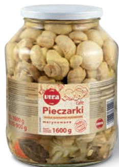
Pieczarki marynowane całe