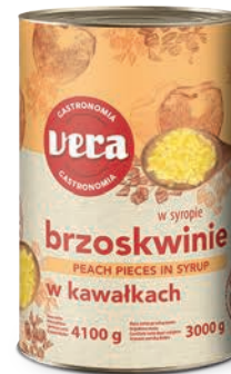
Brzoskwinie w kawałkach w syropie