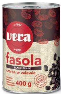
Czarna fasola w zalewie