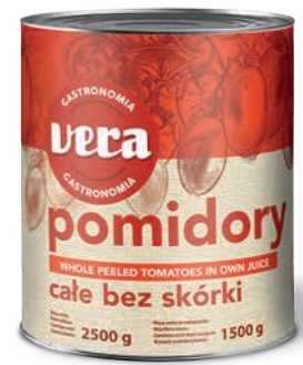
Pomidory bez skórki całe w sosie własnym