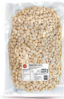
Fasola biała w zalewie w puchu