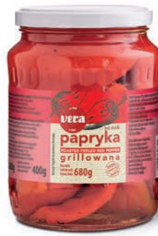
Papryka grillowana bez skórki