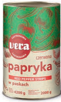
Papryka konserwowa w paskach