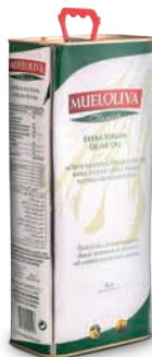
Oliwa z oliwek najwyŹszej jakoŹci z pierwszego tŹoczenia (TIN) Mueloliva