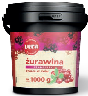
Owoce żurawiny w żelu