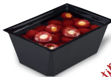
Papryczki czereśniowe z nadzieniem serowym w oleju