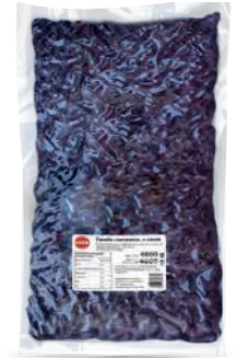
Fasola czerwona w zalewie w puchu