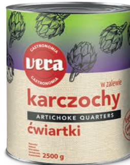
Karczochy ćwiartki w zalewie