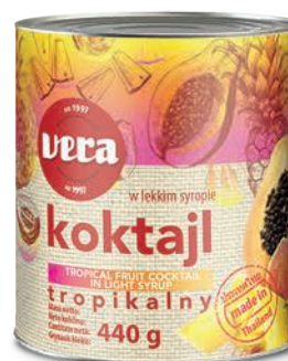
Koktajl tropikalny w syropie