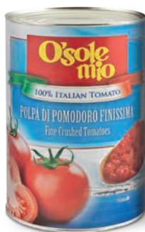
Pulpa pomidorowa O'Sole mio