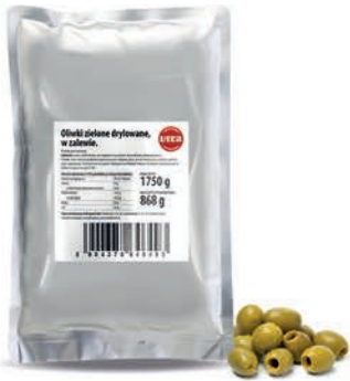
Oliwki czarne drylowane w zalewie