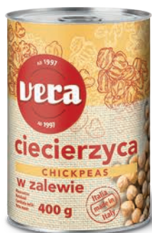
Ciecierzycza w zalewie