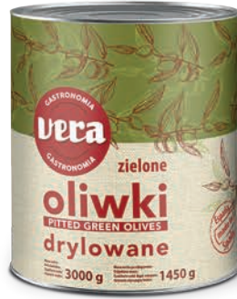
Oliwki zielone drylowane