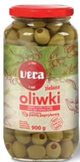
Oliwki zielone nadziewane pastą paprykową