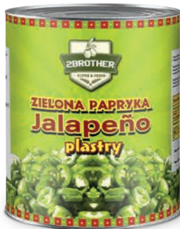
Papryka zielona konserwowa Jalapeño plastry