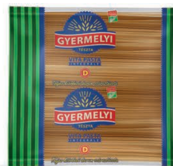
Makaron z pszenicy durum pełnoziarnisty Spaghetti