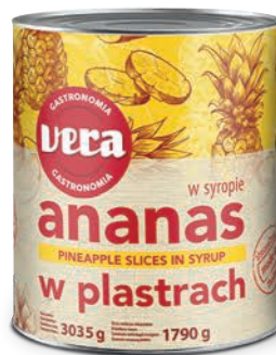
Ananas w plastrach w syropie