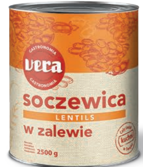
Soczewica w zalewie