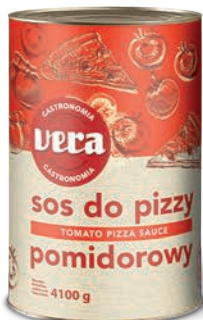
Sos do pizzy pomidorowy