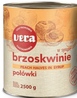
Brzoskwinie połówki w syropie