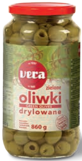
Oliwki zielone drylowane