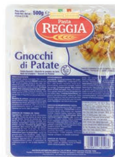
Gnocchi kluski ziemniaczane