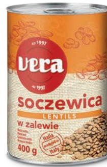
Soczewica w zalewie