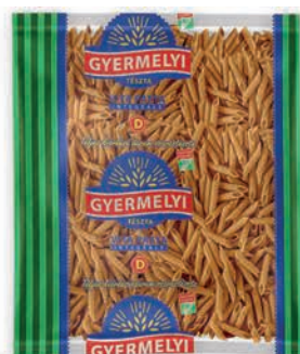
Makaron z pszenicy durum pełnoziarnisty Penne