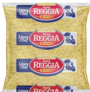
Makaron Spaghetti Tagliati nitki