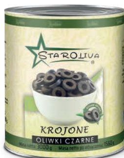
Oliwki czarne krojone