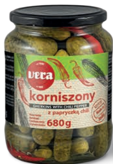
Korniszony delikatesowe z chili