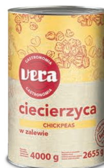
Ciecierzycza w zalewie