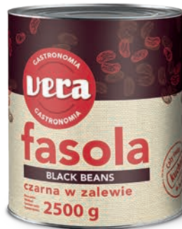
Czarna fasola w zalewie