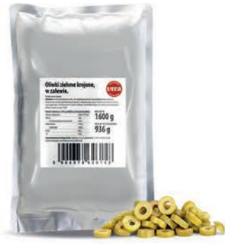
Oliwki zielone drylowane w zalewie