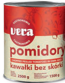
Pomidory bez skórki w kawałkach w sosie własnym