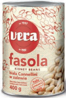
Fasola biała Cannellini