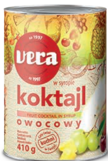
Koktajl owocowy w syropie