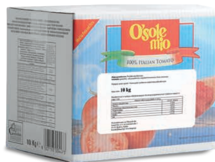
Pulpa pomidorowa O'Sole mio bag in box 2x5kg