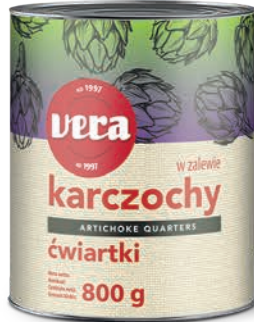
Karczochy ćwiartki w zalewie