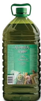
Oliwa z wyciŹczyn z oliwek Alianza