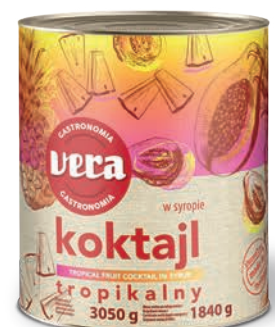
Koktajl tropikalny w syropie