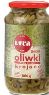
Oliwki zielone krojone