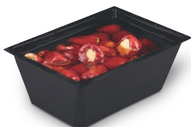
Pikantne czerwone papryczki z nadzieniem serowym w oleju