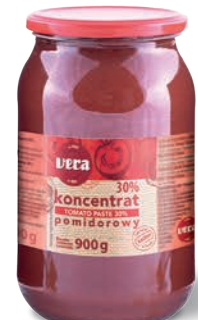
Koncentrat pomidorowy 30%