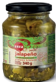
Papryka Jalapeño zielona krojona w zalewie