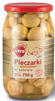
Pieczarki całe w zalewie