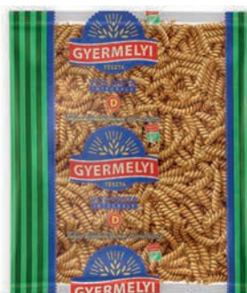
Makaron z pszenicy durum pełnoziarnisty Fusilli