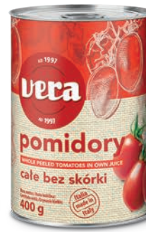
Pomidory bez skórki całe w sosie własnym