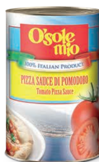
Sos do pizzy pomidorowy O'Sole mio