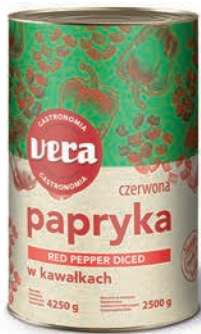
Papryka konserwowa w kawałkach