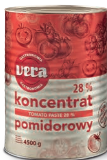
Koncentrat pomidorowy 28%