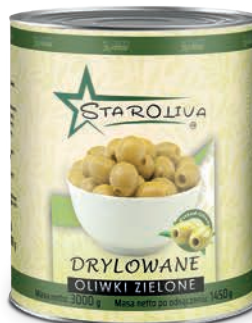
Oliwki zielone drylowane