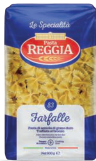
Makaron Farfalle kokardki