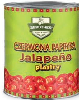
Papryka czerwona konserwowa Jalapeño plastry