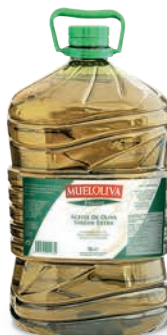
Oliwa z oliwek najwyŹszej jakoŹci z pierwszego tŹoczenia (PET) Mueloliva