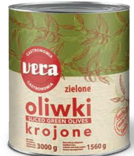
Oliwki zielone krojone