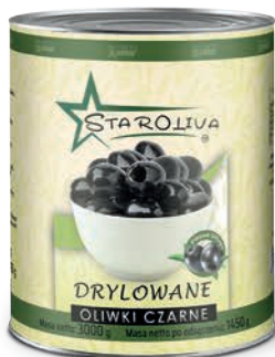
Oliwki czarne drylowane