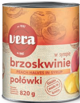
Brzoskwinie połówki w syropie